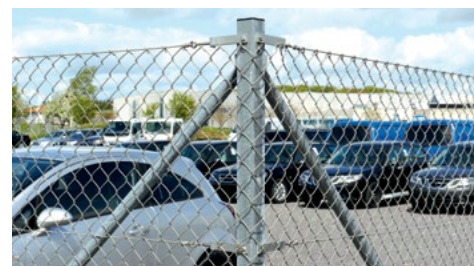
Firkantstolpe 60 x 60 x 3 mm, fremstillet iht. EN 20219/1+2 sættes i beton styrke 16 til frostfri dybde.

Det er monteret på varmgalvaniserede firkantpæle i dimension 60 x 40 x 2 mm. Pæle er sat i beton til frostfri dybde med en center til center afstand på 300 cm. Pæle kan også fastgøres på eventuelt betondæk med fodplader. Montering på væg og mur er også muligt.